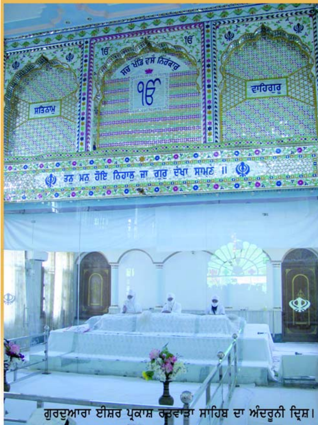
ਗੁਰਦੁਆਰਾ ਈਸ਼ਰ ਪ੍ਰਕਾਸ਼ ਰਤਵਾੜਾ ਸਾਹਿਬ ਦਾ ਅੰਦਰੂਨੀ ਦ੍ਰਿਸ਼।

ਨਿਰਮਾਣ ਕੀਤਾ। ਆਤਮ ਮਾਰਗ ਮੈਗਜ਼ੀਨ, ਪੁਸਤਕਾਂ, ਕੈਸਟਾਂ ਰਾਹੀਂ ਰੂਹਾਨੀਅਤ ਦਾ ਪ੍ਰਚਾਰ ਕੀਤਾ ਜੋ ਹੁਣ ਵੀ ਸੇਵਕਾਂ ਰਾਹੀਂ ਚੜ੍ਹਦੀ ਕਲਾ ਵਿਚ ਚਲ ਰਹੀਆਂ ਹਨ। ਮੈਡੀਕਲ ਕੈਂਪ ਦੇ 200 ਪ੍ਰਾਣੀਆਂ ਦੇ ਅੱਖਾਂ ਦਾ ਚੈਕਅਪ ਉਪਰੰਤ ਆਪ੍ਰੋਸ਼ਨ ਕੀਤੇ ਜਾਣੇ ਹਨ। ਆਤਮ ਮਾਰਗ ਮੈਗਜ਼ੀਨ ਅਤੇ ਮਹਾਂਪੁਰਸ਼ਾਂ ਵਲੋਂ ਪ੍ਰਕਾਸ਼ਿਤ ਪੁਸਤਕਾਂ ਭੇਟਾ ਤੇ ਸੰਗਤਾਂ ਨੇ ਹਾਸਲ ਕੀਤੀਆਂ।